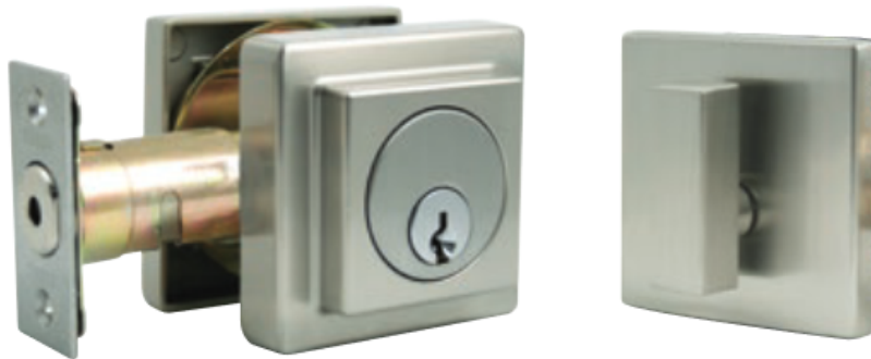
QUADRA NICKEL SATINÉ