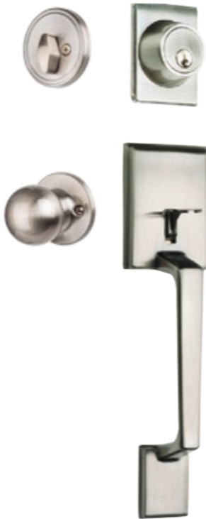
CAPRI NICKEL SATINÉ